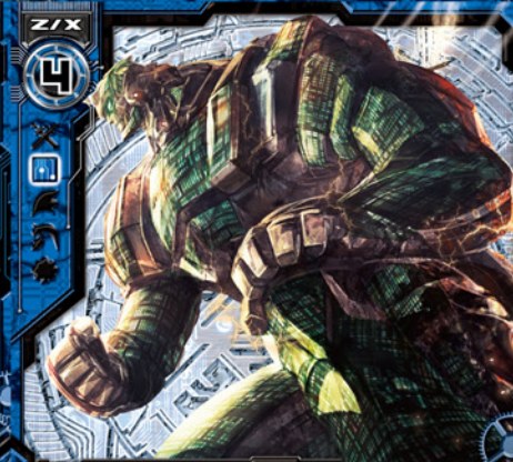
鋼城ユウロビウム

©BROCCOLI/Nippon Ichi Software, Inc. Illust:石田ハル (しーていごーどふえくた)