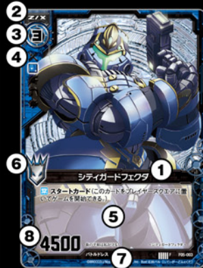
ゼクスカード スクエアで戦うカードです。