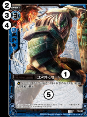
イベントカード 使い切りの強力なカードです。