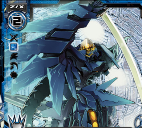
抹消機械イレイス

©BROCCOLI/Nippon Ichi Software, Inc. Illust:七六 (まっしゅうきまいいれいす)