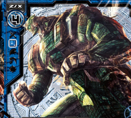
鋼城ユウロビウム

©BROCCOLI/Nippon Ichi Software, Inc. Illust:日田康浩 (こうじょうゆうろびうむ)