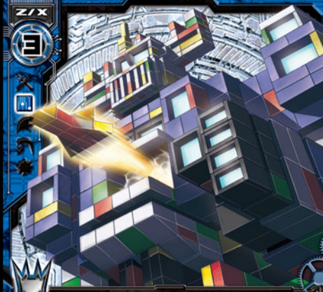
鋼城テクネチウム

©BROCCOLI/Nippon Ichi Software, Inc. Illust:七六 (まっしゅうきまいいれいす)