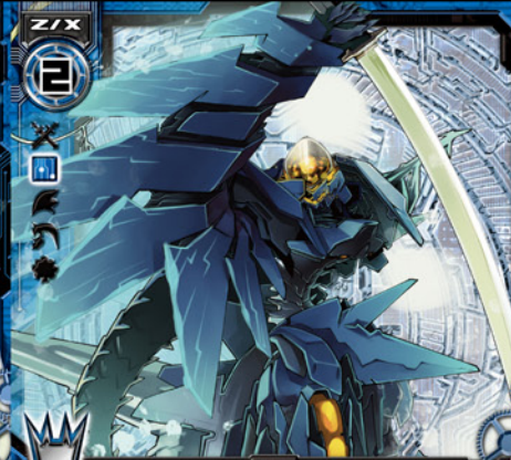
抹消機械イレイス

©BROCCOLI/Nippon Ichi Software, Inc. Illust:七六 (まっしゅうきまいいれいす)