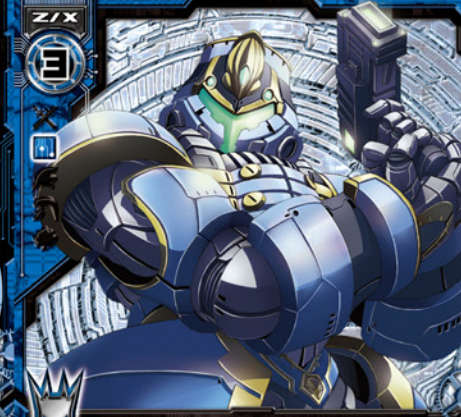
シティガードフェクタ

©BROCCOLI/Nippon Ichi Software, Inc. Illust:石田ハル (しーていごーどふえくた)