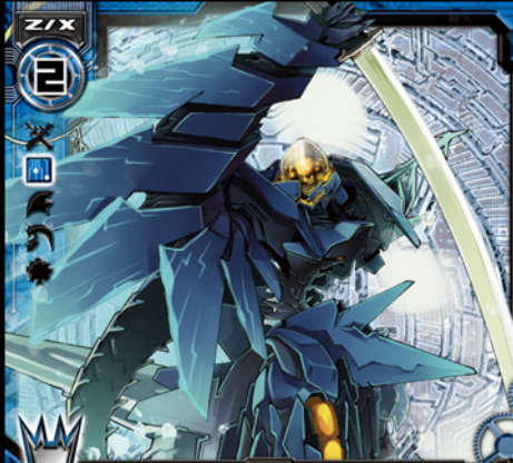
抹消機械イレイス

自 このカードが登場した時、カードを1枚引き、自分の手札にあるカードを1枚選んでデッキに戻し、シャッフルする。