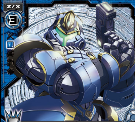
シティガードフェクタ

©BROCCOLI/Nippon Ichi Software, Inc. Illust:石田ハル (しーていごーどふえくた)